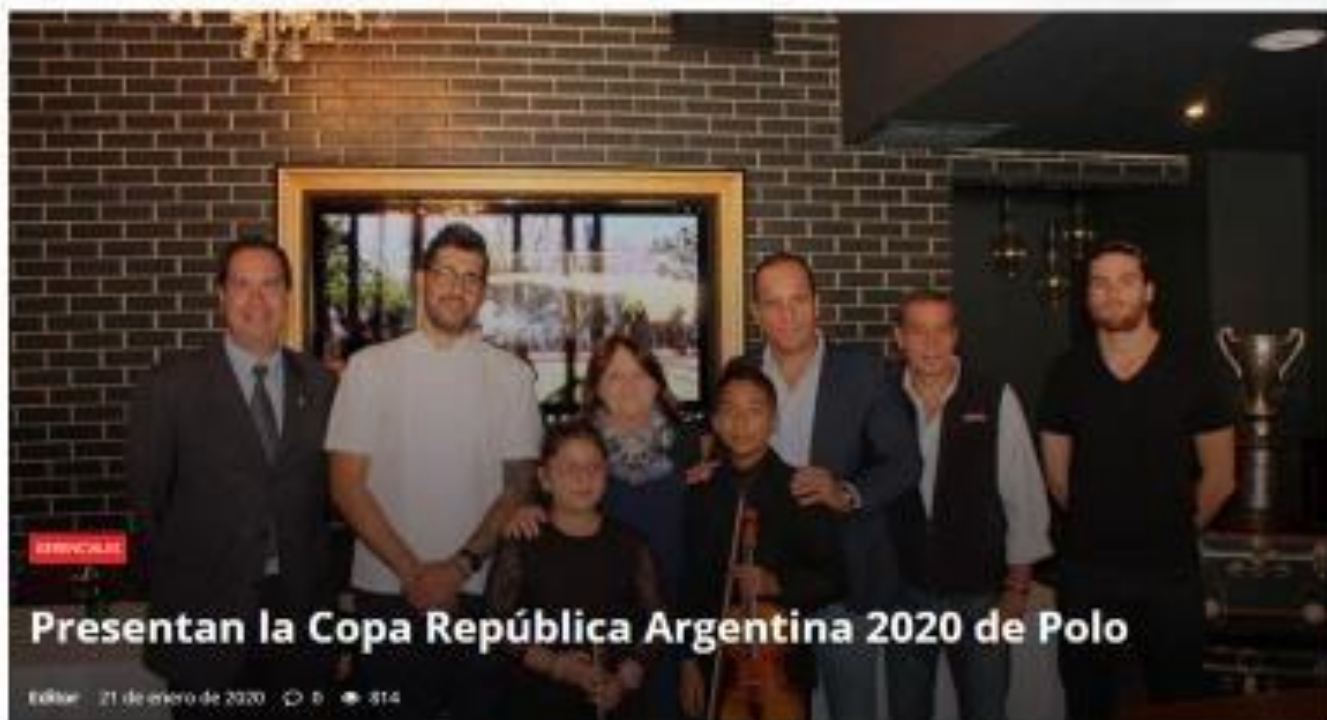
Presentan la Copa República Argentina 2020 de Polo